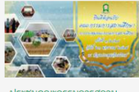
ประชุมคณะกรรมการสถานศึกษา 1/2567

https://docs.google.com/forms/d/e/1FAIpUk68sbfhhU9Lxo44n8YJzoO8XT89FrNyYcusp=sharing