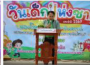
กิจกรรมวันเด็กแห่งชาติ 2567