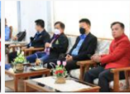
โรงเรียนวัดดอนไต้ศึกษา ดูงานและแลกเปลี่ยนเรียนรู้ โครงการห้องเรียนพิเศษ EP/วิทย์ คณิต เทคโนโลยี/ภาษาจีน