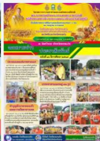
โครงการบรรพชาสามเณรเฉลิมพระเกียรติ ร.10 28 ก.ค.67 6 รอบ 72 พรรษา