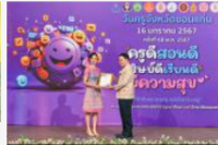
วันครูแห่งชาติ 2567