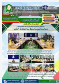
ประชุมคณะกรรมการสถานศึกษา ครั้งที่ 3/2567 ณ ห้องประชุมเกียรติยศ