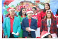
กิจกรรมวันคริสต์มาส