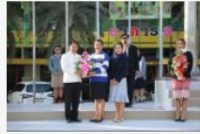
ต้อนรับครูใหม่ และครูผู้สำเร็จการศึกษา