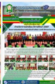
ค่ายวิชาการนักเรียน ปีการศึกษา 2567 โครงการส่งเสริมศักยภาพนักเรียนด้านศิลปะ ดนตรี กีฬาและวิชาการ